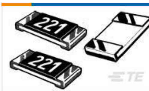
TE 产品编号4-2176230-7 3522 5K6 5% 3W