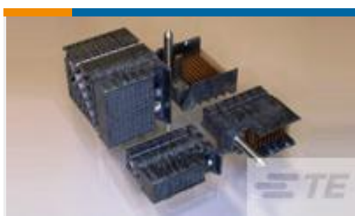
TE 产品编号 2110124-1 IMP100S,R,RA5P16C,UG,39