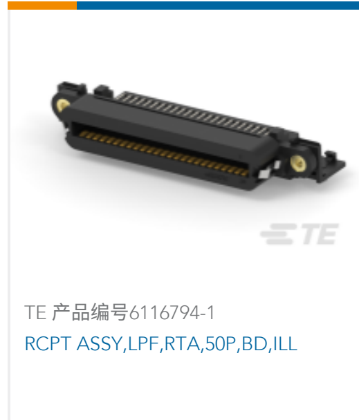
TE 产品编号6116794-1 RCPT ASSY,LPF,RTA,50P,BD,ILL