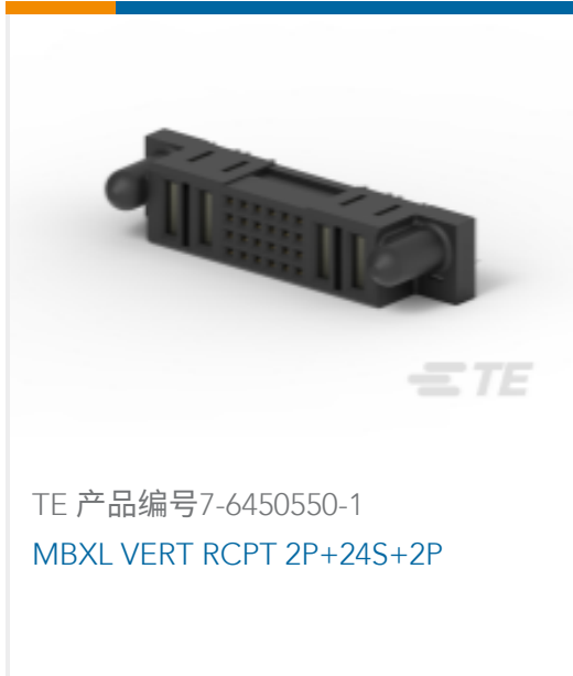
TE 产品编号7-6450550-1 MBXL VERT RCPT 2P+24S+2P