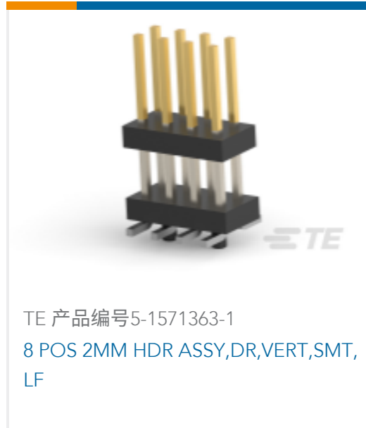
TE 产品编号5-1571363-1 8 POS 2MM HDR ASSY,DR,VERT,SMT, LF