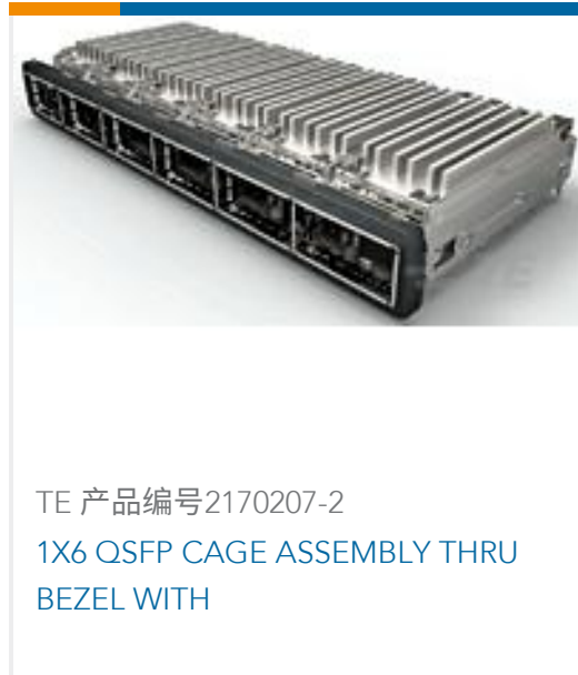
TE 产品编号2170207-2 1X6 QSFP CAGE ASSEMBLY THRU BEZEL WITH