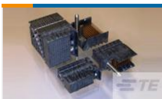
TE 产品编号 2110106-1 IMP100S,R,RA5P10C,UG,39