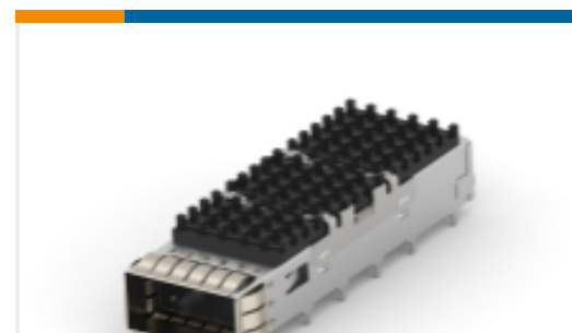
TE 产品编号1-2170704-3 CAGE ASSY, QSFP28 1X1, SPRING, CZ_HS