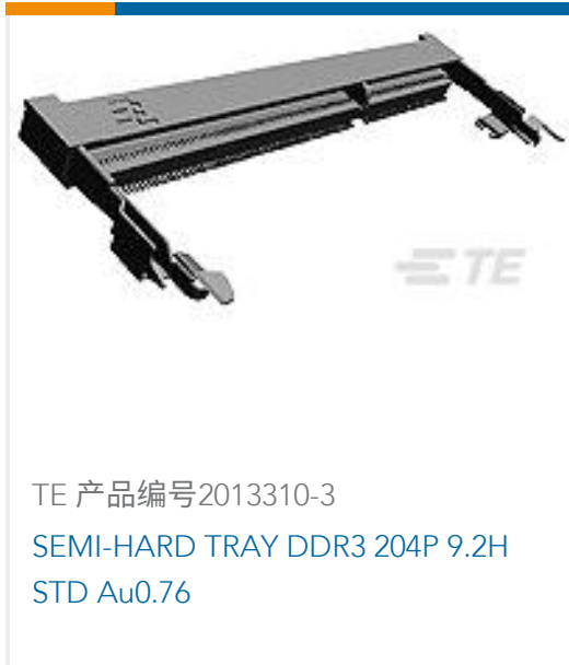
TE 产品编号2013310-3 SEMI-HARD TRAY DDR3 204P 9.2H STD Au0.76