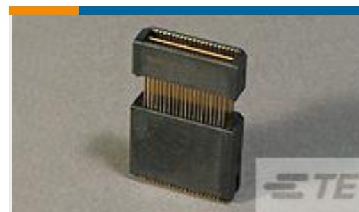
TE 产品编号1658470-1 MSB0.80PL30ASY040FL,-,30,-TY