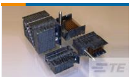
TE 产品编号1-2007715-1 IMP100S,R,RA4P10C,LG,39