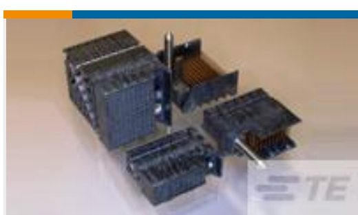
TE 产品编号 2110106-1 IMP100S,R,RA5P10C,UG,39