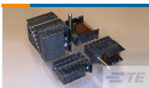
TE 产品编号2007902-3 IMP100S,H,V6P16C,UG,DEW39,5.5