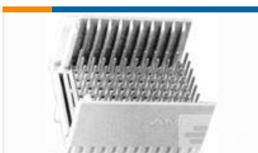
TE 产品编号5646884-1 2MMHM TYPE A/B 125 POS INVERSE