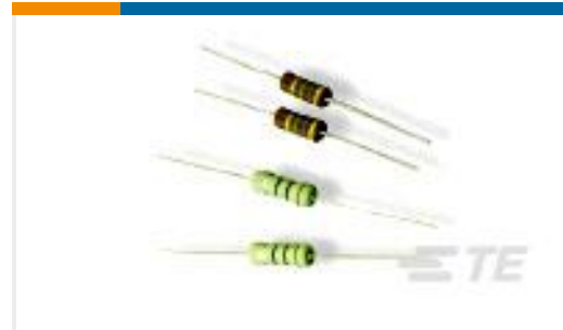
TE 产品编号2-1625876-1 CBT 1/2 5% 4R7