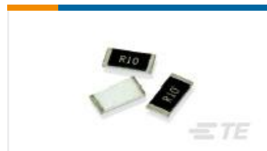
TE 产品编号4-1622825-6 RL73K 3A R27 5% 4K RL