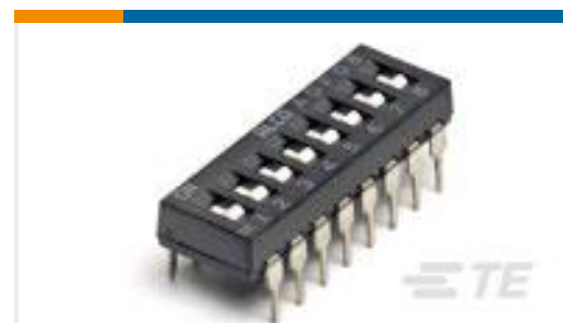
TE 产品编号1-1825002-7 ADF1004=DIP SWT,FLUSH,THRU/HL