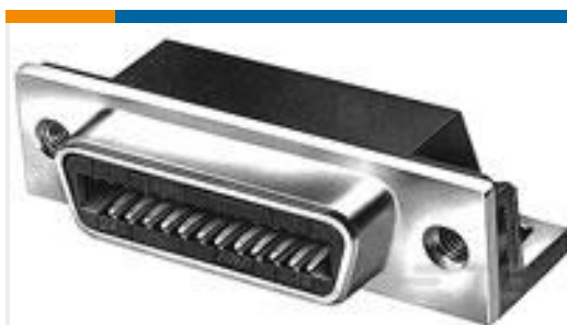
TE 产品编号5553813-3 ASSY,EMI RCPT,50 POSN,SCR LK