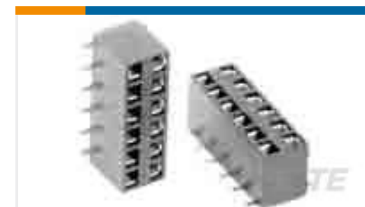
TE 产品编号2-969973-0 2x20P HV100 REC. CON, SMD, GOLD, BLISTER