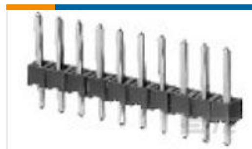
TE 产品编号5-146276-2 02 MODII HDR SRST B/A .100CL