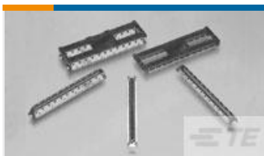
TE 产品编号3-1827253-6 .5FHP05H,220,S,GIG,08/Sn,HT,NSYes