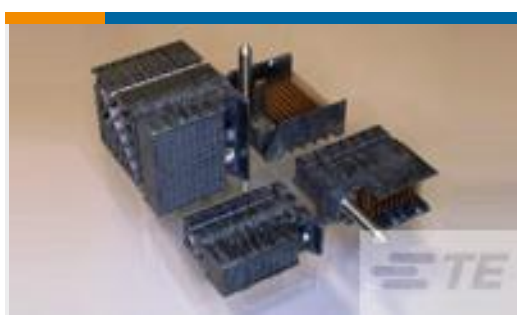
TE 产品编号 2007723-1 IMP100S,R,RA4P16C,UG,39