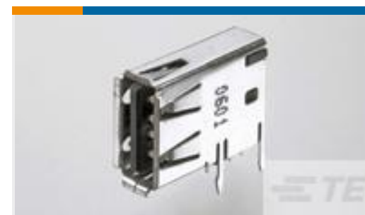
TE 产品编号292336-1 Std USB Type A, Flag, T/H