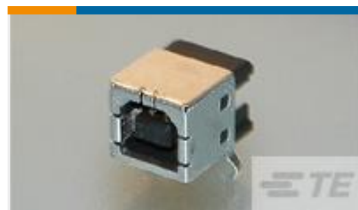
TE 产品编号292304-2 STD USB TYPE B, R/A, T/H