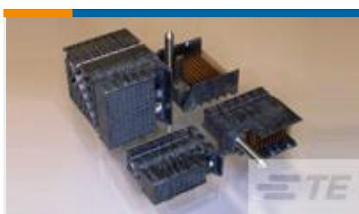
TE 产品编号 2007723-1 IMP100S,R,RA4P16C,UG,39