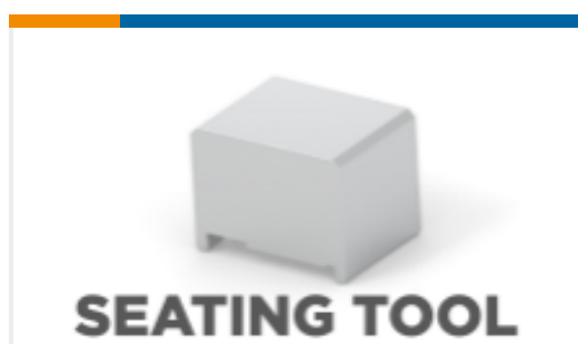
TE 产品编号 2018513-1 TL, SEAT 4 PR 16 COL BP CONN