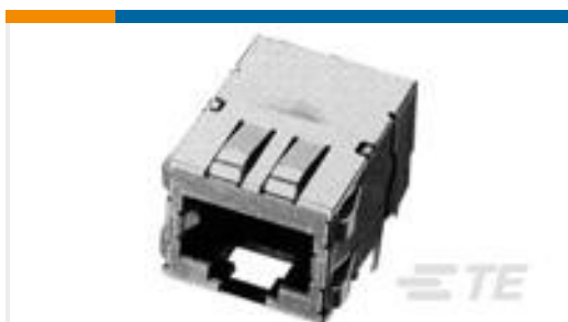
TE 产品编号 3-5338556-1 8/8 MOD JACK ASSY SE