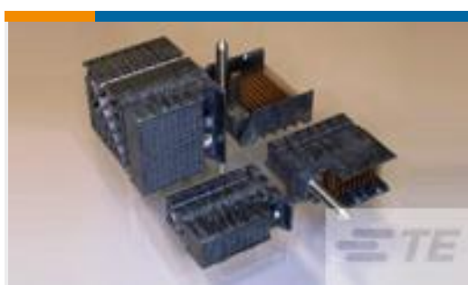
TE 产品编号 2007711-1 IMP100S,R,RA3P16C,UG,39