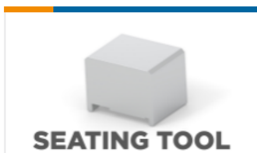
TE 产品编号 2018524-1 TOOL, SEAT 4 PR 10 COL,BP CONN