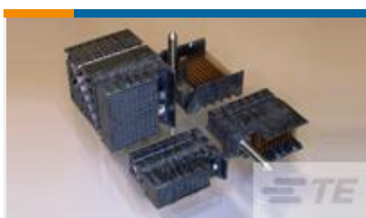
TE 产品编号 2007711-1 IMP100S,R,RA3P16C,UG,39