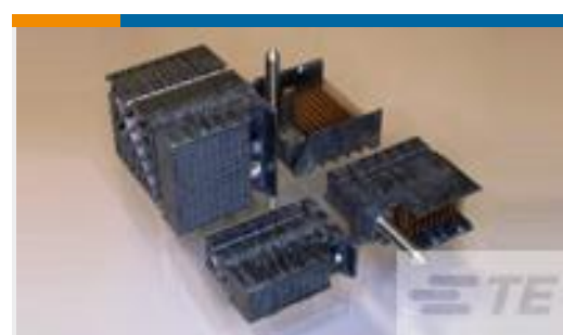
TE 产品编号2007809-2 IMP100S,H,V4P10C,LG,OEW39,4.9