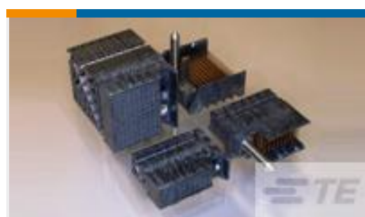
TE 产品编号2007716-1 IMP100S,R,RA4P10C,RG,39