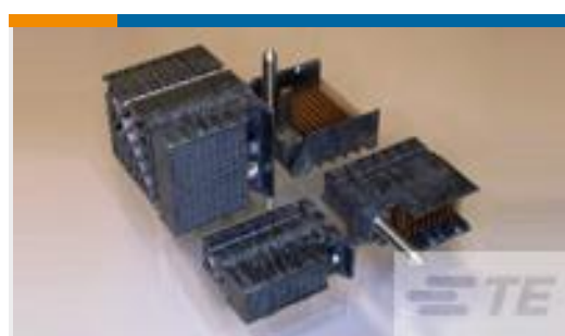
TE 产品编号2007813-1 IMP100S,H,V4P10C,RG,OEW39,4.5