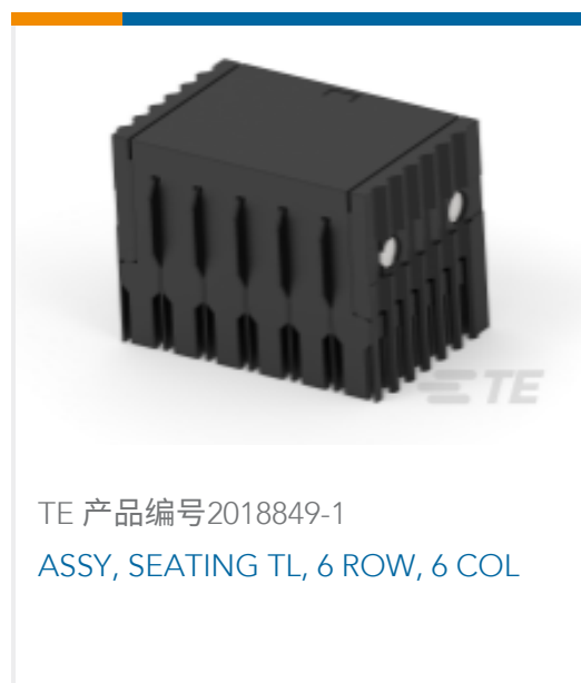
TE 产品编号2018849-1 ASSY, SEATING TL, 6 ROW, 6 COL