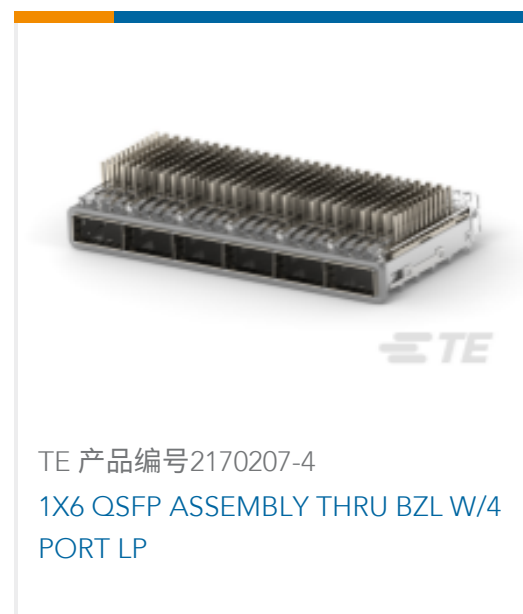
TE 产品编号2170207-4 1X6 QSFP ASSEMBLY THRU BZL W/4 PORT LP