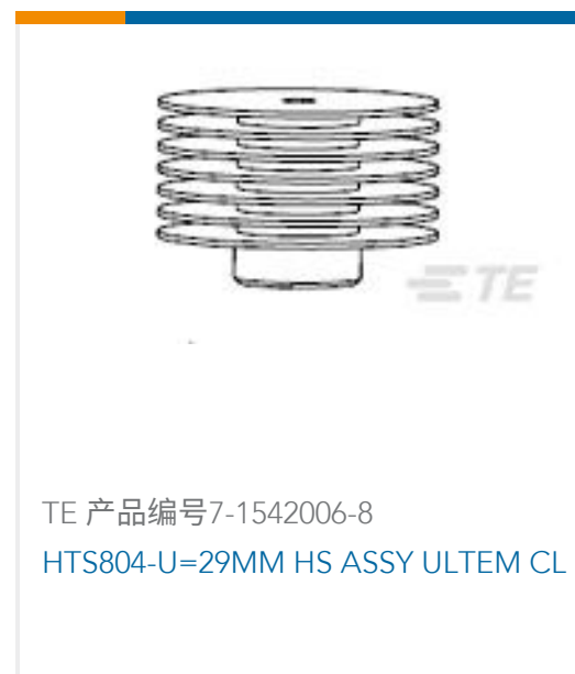
TE 产品编号7-1542006-8 HTS804-U=29MM HS ASSY ULTEM CL