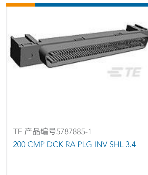
TE 产品编号5787885-1 200 CMP DCK RA PLG INV SHL 3.4