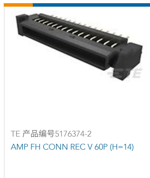
TE 产品编号5176374-2 AMP FH CONN REC V 60P (H=14)