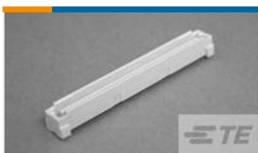
TE 产品编号5084615-2 0.8FH,P06H.5,060,30/Sn,TU