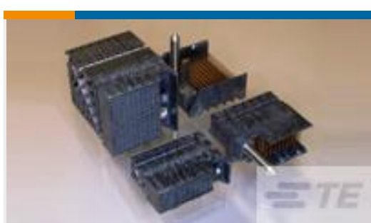
TE 产品编号 2007711-1 IMP100S,R,RA3P16C,UG,39