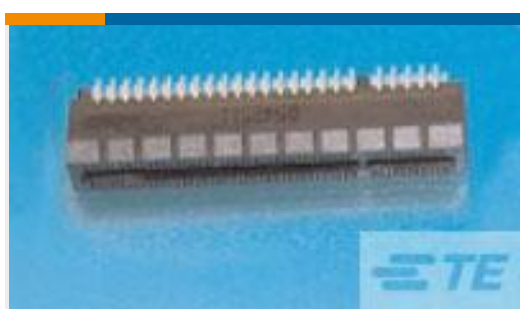
TE 产品编号1-1871058-5 PCI EXPRESS CONN. EON TYPE, 280P, L=3.25