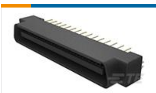
TE 产品编号1734100-3 Champ050 series,30pos,Au over PdNi