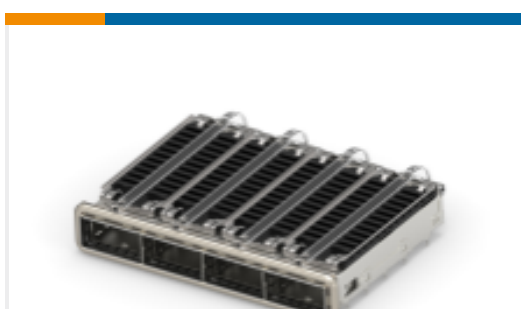
TE 产品编号1-2170287-1 1X4 CAGE ASSEMBLY, QSFP,SINGLE SQ LP