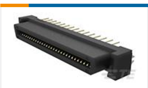
TE 产品编号1734101-3 Champ050 series,30pos,Au over PdNi