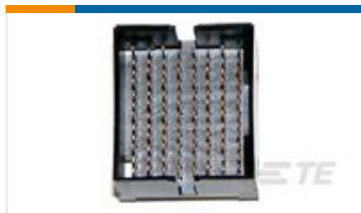
TE 产品编号2065025-1 TinMan vt hdr assy 5pr 10col dbl wall