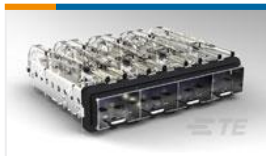
TE 产品编号2110570-1 SFP+ 1x4 Cage Assembly Square Light Pipe