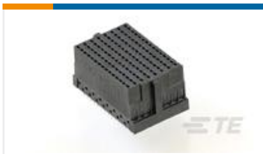
TE 产品编号1934949-1 Tinman 5pr 8col vert recpt 15mm stack