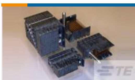
TE 产品编号 2007711-1 IMP100S,R,RA3P16C,UG,39