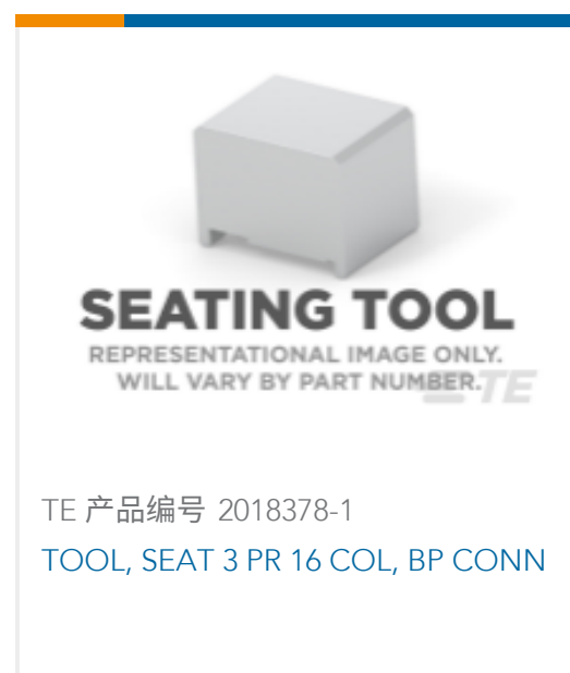
TE 产品编号 2018378-1 TOOL, SEAT 3 PR 16 COL, BP CONN