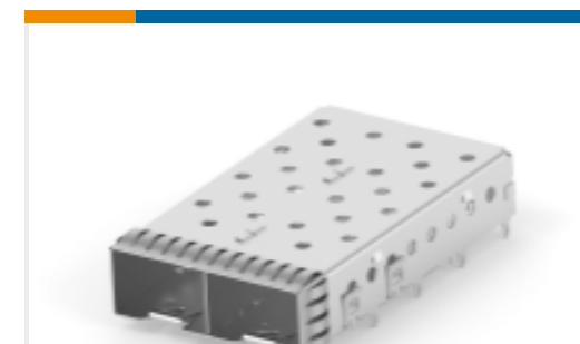
TE 产品编号2007263-3 SFP+ 1x2 Cage Assembly