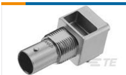
TE 产品编号5227677-1 BNC PCB RT ANG JACK W/POST