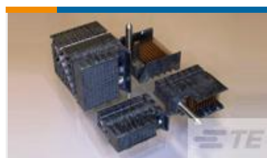
TE 产品编号2007880-3 IMP100S,H,V6P10C,UG,OEW46,5.5