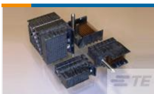
TE 产品编号 2007705-1 IMP100S,R,RA3P10C,UG,39