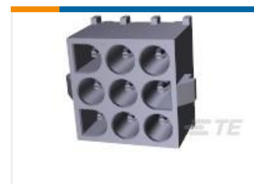
TE 产品编号350742-4 09P UMNL PIN HDR ASSY 94VO LF