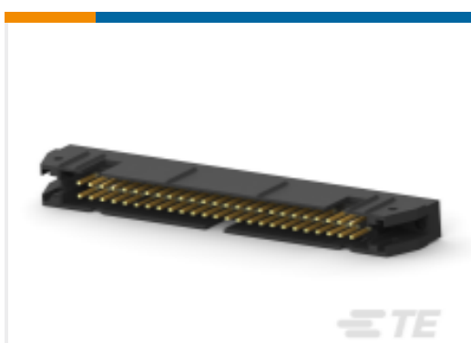
TE 产品编号1658694-4 AMP 锁门通用插头