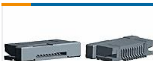
TE 产品编号2-1734592-0 FPC CONN. 0.5MM PITCH B/C, 20P