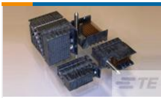
TE 产品编号 2007705-1 IMP100S,R,RA3P10C,UG,39