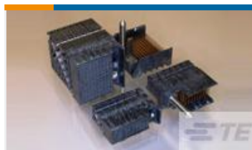
TE 产品编号2057760-3 IMP100S,H,V3P8C,UG,OEW46,5,5