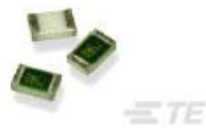
TE 产品编号5-1879215-9 CPF 0402 18K2 0.1% 25PPM 1K RL