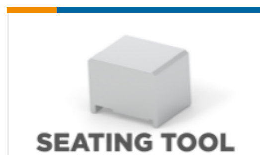
TE 产品编号 2018534-1 TOOL, SEAT 6 PR 14 COL,BP CONN