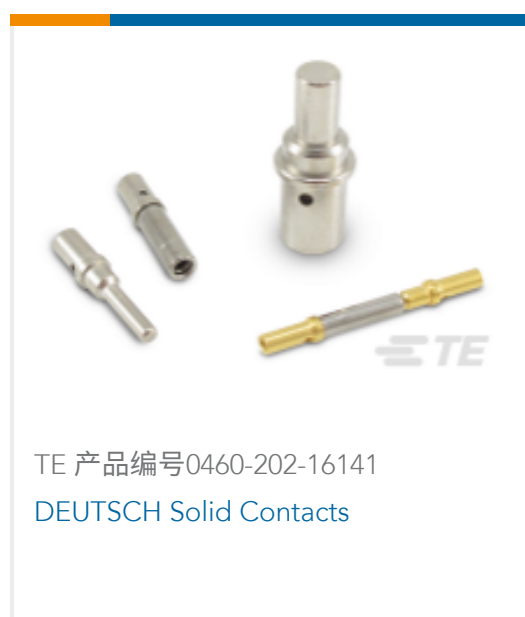
TE 产品编号0460-202-16141 DEUTSCH Solid Contacts