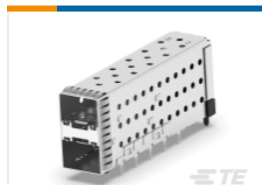
TE 产品编号2007394-5 SFP+ 堆叠壳体组件