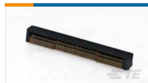
TE 产品编号2057630-1 CFP Receptacle Conn Assy