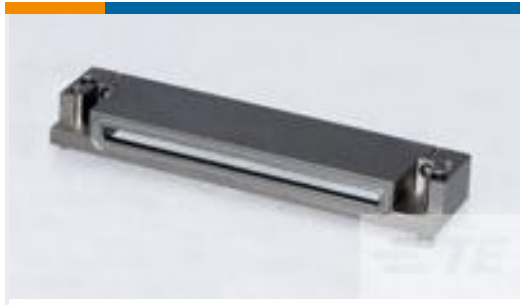
TE 产品编号2057631-1 CFP Receptacle Cover Assy