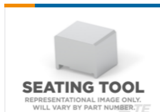
TE 产品编号 2018531-1 TOOL, SEAT 4 PR 16 COL,BP CONN