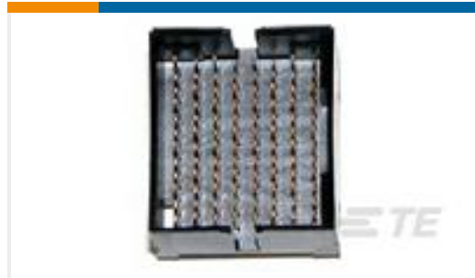
TE 产品编号1934306-1 Tin man Header Assy 4x8 Double