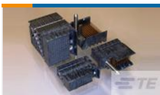
TE 产品编号 2007836-1 IMP100S,H,V4P16C,UG,OEW39,4,5