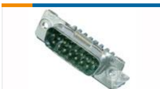
TE 产品编号1-338168-2 9POL HDP20 PLUG