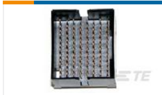
TE 产品编号1934316-1 Tin Man Header Assy 4x16 Double