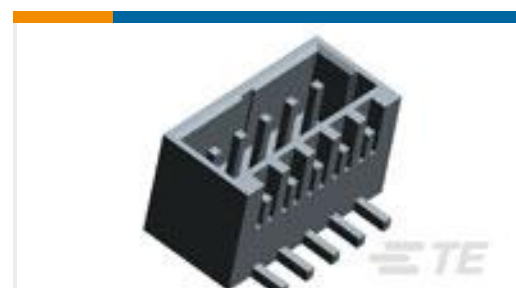
TE 产品编号5-1775443-4 EMIX CONN., 1.5MM PITCH, HDR, V/T, 4P