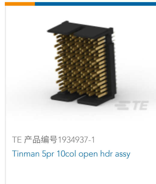
TE 产品编号1934937-1 Tinman Spr 10col open hdr assy