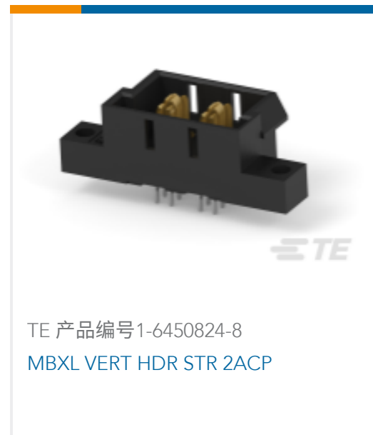
TE 产品编号1-6450824-8 MBXL VERT HDR STR 2ACP