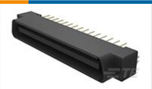
TE 产品编号 1734100-3 Champ050 series, 30pos, Au over PdNi