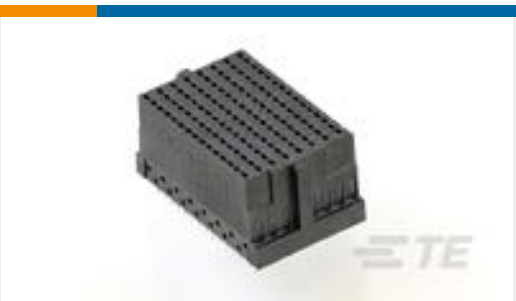
TE 产品编号 1934949-1 Tinman 5pr 8col vert recpt 15mm stack