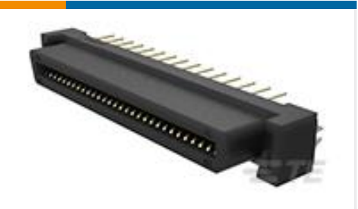
TE 产品编号 1734101-3 Champ050 series, 30pos, Au over PdNi