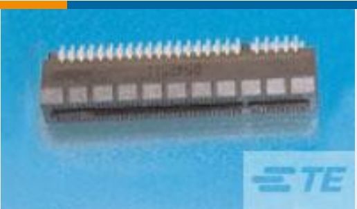
TE 产品编号 1-1871058-5 PCI EXPRESS CONN. EON TYPE, 280P, L=3.25