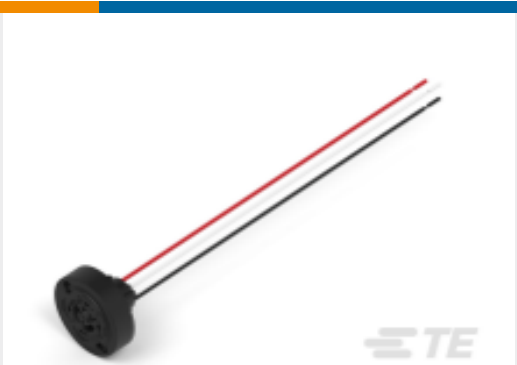
TE 产品编号 6-2213362-2 RCPT ASSY, DIMMABLE PHOTOCONTROL, 150C, 3 P