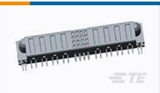
TE 产品编号 2-6450880-4 MBXLE R/A RCPT 4P16S4P