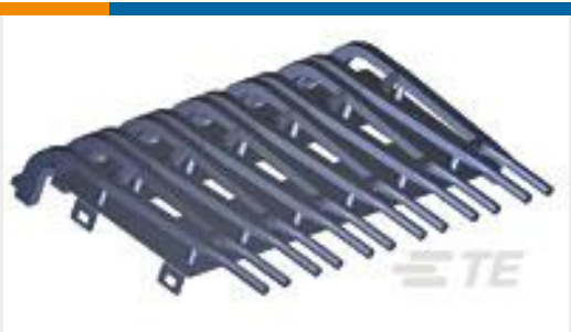
TE 产品编号 2007174-2 SFP 1x6 Light Pipe Assy, Reduced Length