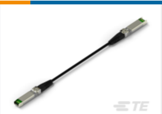
TE 产品编号 4-2334985-2 SFP56 DIRECT ATTACH CA, 1M, 32AWG