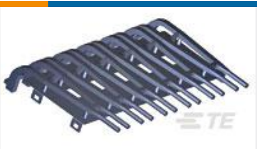
TE 产品编号 2007174-3 SFP 1x6 Light Pipe Assy, Reduced Length