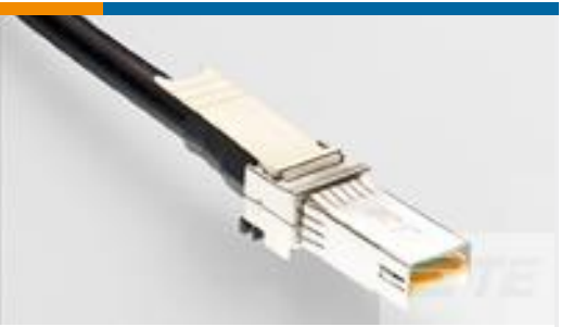
TE 产品编号 2142970-1 CABLE ASSY, MICRO SFP+ TO STD SFP+, 0.5M