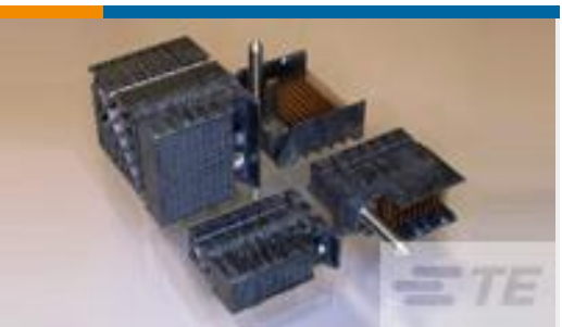
TE 产品编号 2007808-2 IMP100S, H, V4P10C, LG, OEW46, 4, 9