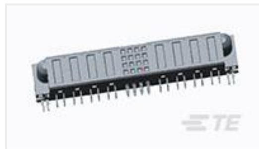
TE 产品编号2-6450880-4 MBXLE R/A RCPT 4P16S4P