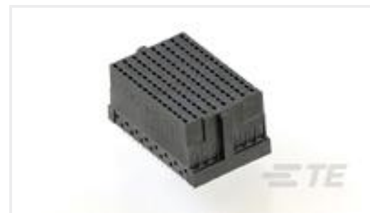
TE 产品编号1934949-1 Tinman 5pr 8col vert rcpt 15mm stack