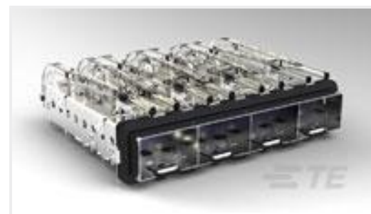
TE 产品编号2110570-1 SFP+ 1x4 Cage Assembly Square Light Pipe