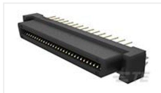
TE 产品编号1734101-3 Champ050 series, 30pos, Au over PdNi