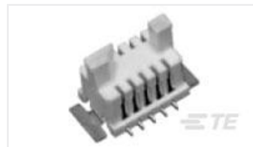
TE 产品编号5-1375870-4 RCPT ASSY, 12 POS, VERT, 0.8MM MI