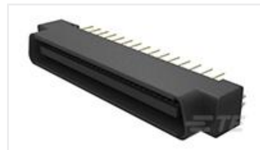
TE 产品编号1734100-3 Champ050 series, 30pos, Au over PdNi