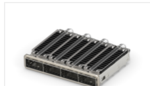
TE 产品编号1-2170287-1 1X4 CAGE ASSEMBLY, QSFP, SINGLE SQ LP