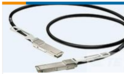
TE 产品编号 2829040-6 QSFP IB EDR, 30AWG, 2.0M