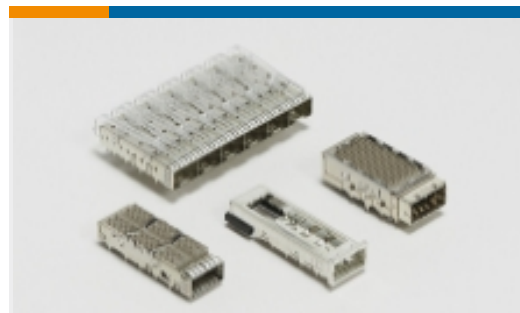
插拔式 IO 连接器和笼子(158)