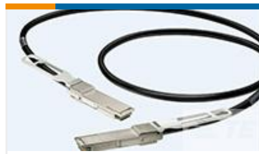
TE 产品编号 2829040-7 QSFP IB EDR, 26AWG, 2.0M