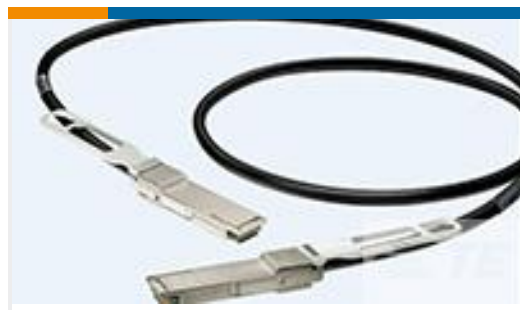
TE 产品编号 2829040-4 QSFP IB EDR, 30AWG, 1.0M