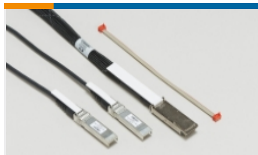
插拔式 I/O 电缆部件(19)