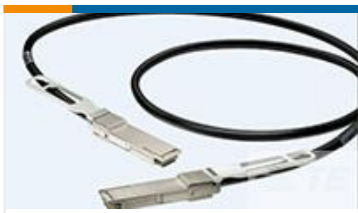
TE 产品编号 2829040-2 QSFP IB EDR, 33AWG, 1.0M