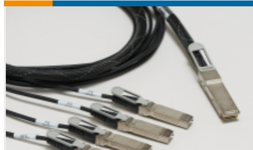
TE 产品编号 2821033-8 QSFP TO [4]SFP+, 28G, 1M, 33AWG