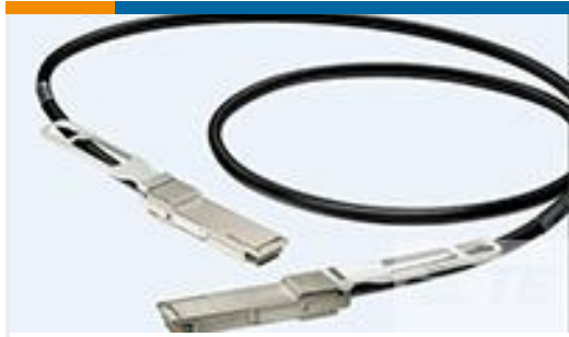
TE 产品编号 2829040-8 QSFP IB EDR, 26AWG, 3.0M