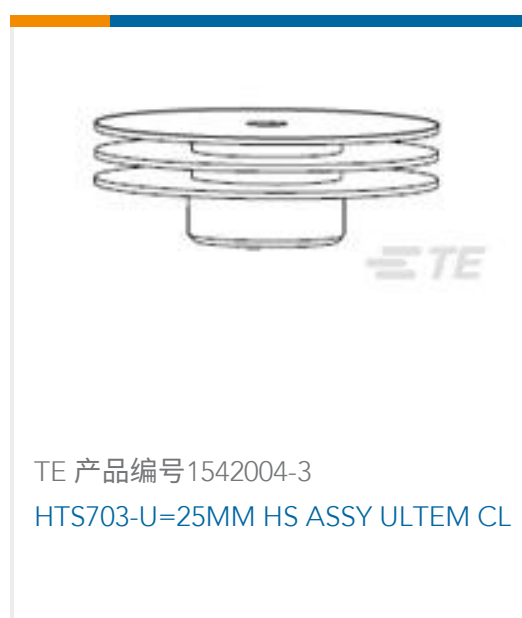
TE 产品编号1542004-3 HTS703-U=25MM HS ASSY ULTEM CL