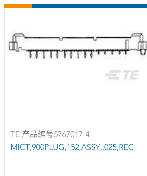
TE 产品编号5767017-4 MICT,900PLUG,152,ASSY,.025,REC