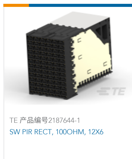
TE 产品编号2187644-1 SW PIR RECT, 100OHM, 12X6