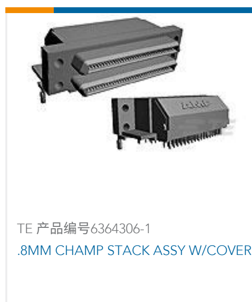
TE 产品编号6364306-1 .8MM CHAMP STACK ASSY W/COVER