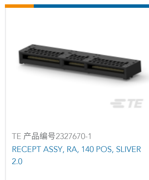
TE 产品编号2327670-1 RECEPT ASSY, RA, 140 POS, SLIVER 2.0