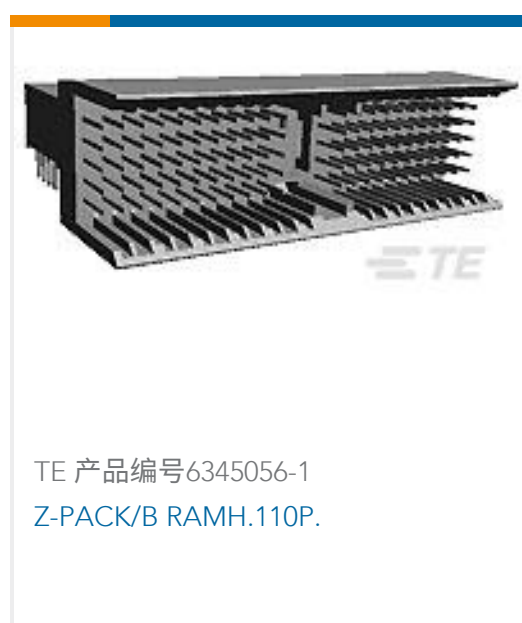
TE 产品编号6345056-1 Z-PACK/B RAMH.110P.