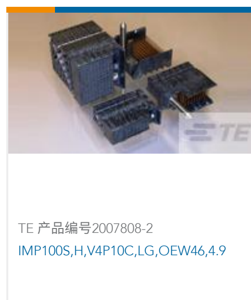
TE 产品编号 2007808-2 IMP100S, H, V4P10C, LG, OEW46, 4.9