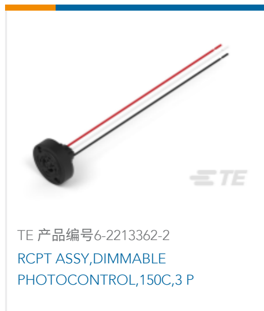
TE 产品编号 6-2213362-2 RCPT ASSY, DIMMABLE PHOTOCONTROL, 150C, 3 P