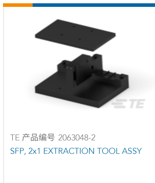
TE 产品编号 2063048-2 SFP, 2x1 EXTRACTION TOOL ASSY