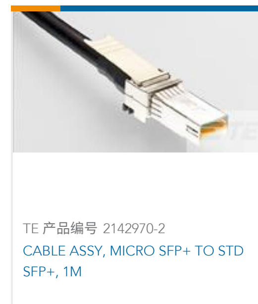
TE 产品编号 2142970-2 CABLE ASSY, MICRO SFP+ TO STD SFP+, 1M