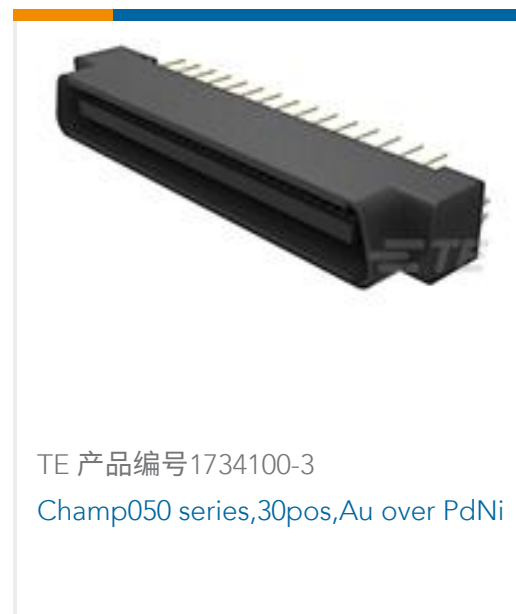
TE 产品编号 1734100-3 Champ050 series, 30pos, Au over PdNi