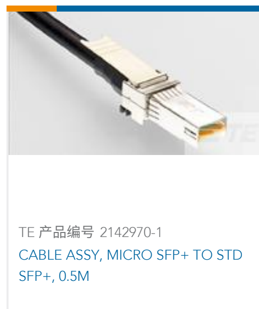
TE 产品编号 2142970-1 CABLE ASSY, MICRO SFP+ TO STD SFP+, 0.5M