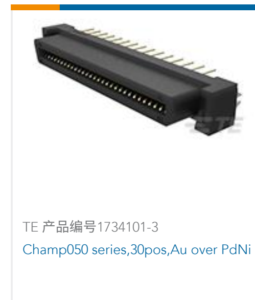
TE 产品编号 1734101-3 Champ050 series, 30pos, Au over PdNi