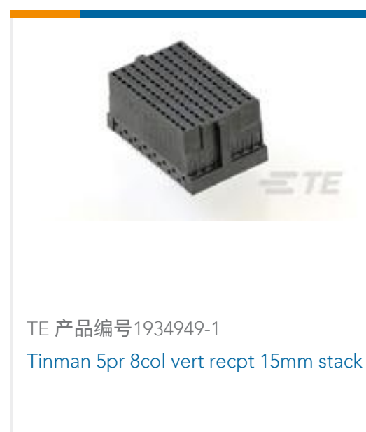
TE 产品编号 1934949-1 Tinman 5pr 8col vert recpt 15mm stack