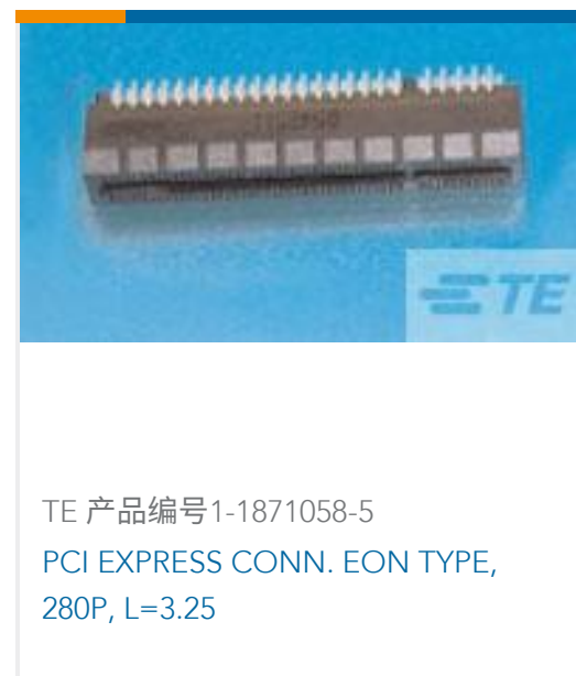
TE 产品编号 1-1871058-5 PCI EXPRESS CONN. EON TYPE, 280P, L=3.25