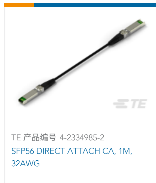
TE 产品编号 4-2334985-2 SFP56 DIRECT ATTACH CA, 1M, 32AWG