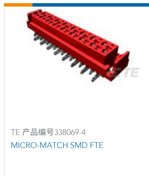
TE 产品编号338069-4 MICRO-MATCH SMD FTE