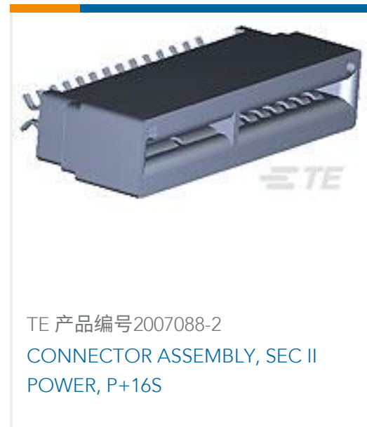
TE 产品编号2007088-2 CONNECTOR ASSEMBLY, SEC II POWER, P+16S