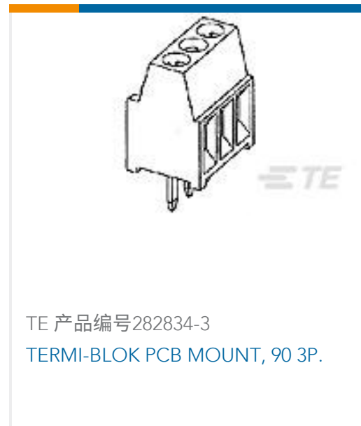
TE 产品编号282834-3 TERMI-BLOK PCB MOUNT, 90 3P.