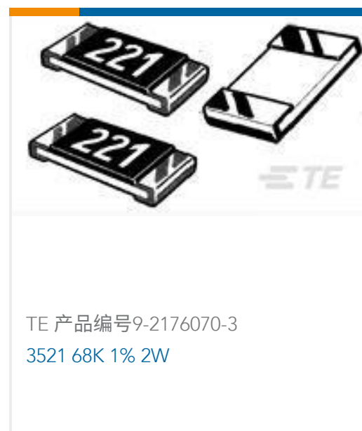
TE 产品编号9-2176070-3 3521 68K 1% 2W