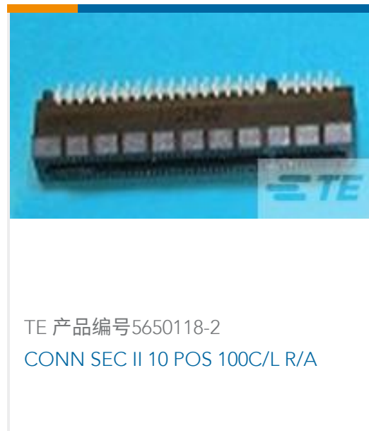
TE 产品编号5650118-2 CONN SEC II 10 POS 100C/L R/A