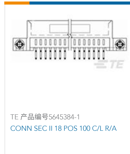
TE 产品编号5645384-1 CONN SEC II 18 POS 100 C/L R/A