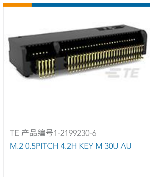
TE 产品编号1-2199230-6 M.2 0.5PITCH 4.2H KEY M 30U AU