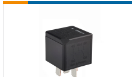
TE 产品编号1-1414687-0 V23136A0004X059-EV-CBOX