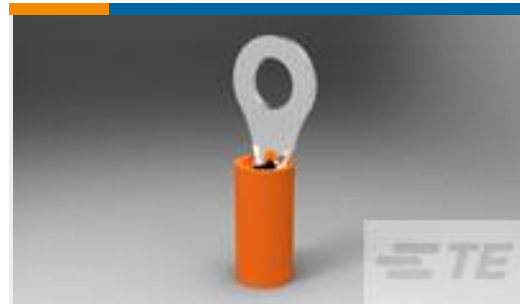
TE 产品编号50836 TERMINAL,PIDG PTFE R 18-16 8