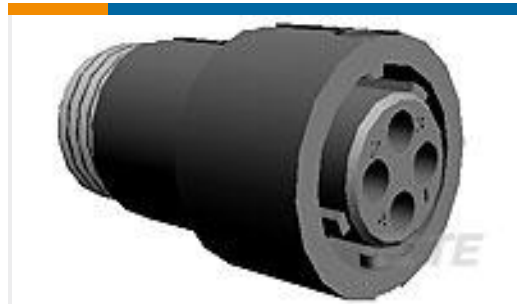
TE 产品编号1445535-1 PLUG,8-2,LG INS,STD KEY