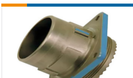
TE 产品编号YDIV46E21-35SNV001 PLUG ASSY