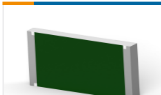
TE 产品编号6-2176403-2 3550 360R 1%