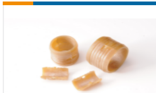
TE 产品编号EM6344-000 R85049/93-10