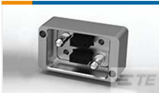
TE 产品编号2000973-1 Connector Kit, Rcpt, Backplane, MT, V66.1