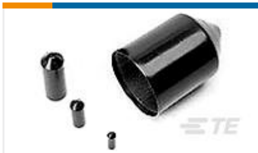
TE 产品编号843409-000 101A073-4-0