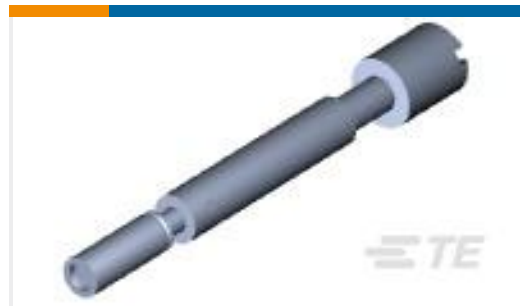
TE 产品编号201414-1 SERIES "M" JACK SCREW--FEMALE A