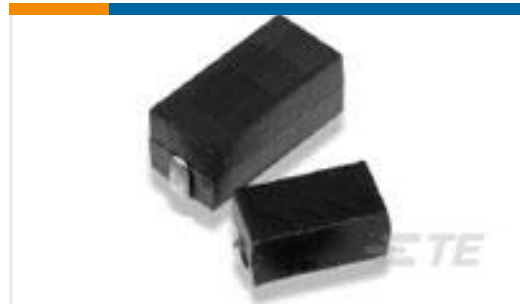
TE 产品编号4-1676966-7 SMW2 8R2 5%