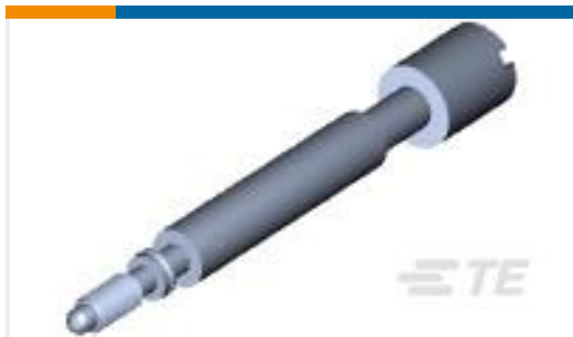
TE 产品编号201413-4 JACKSCREW ASSY. SERIES "M"