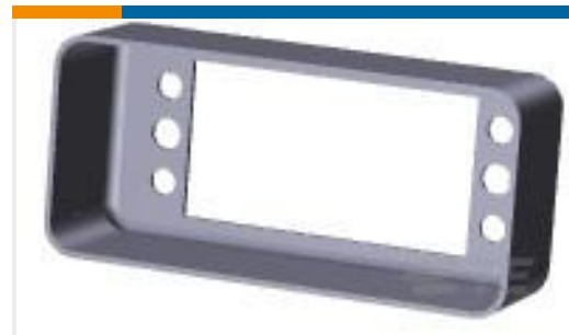
TE 产品编号201350-2 34 PL. PIN HOOD