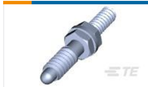
TE 产品编号201092-4 SER. "M" JACKSCREW STUD KIT