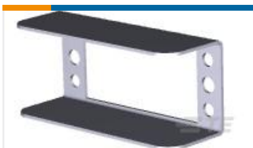
TE 产品编号201786-4 34 PL. PIN HOOD