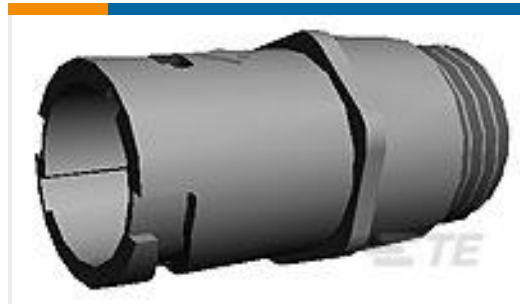
TE 产品编号1445522-3 REC,8-2,FRE HNG,LG INS,STD KEY