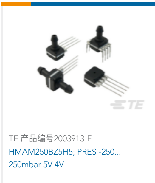
TE 产品编号2003913-F HMAM250BZ5H5; PRES -250... 250mbar 5V 4V