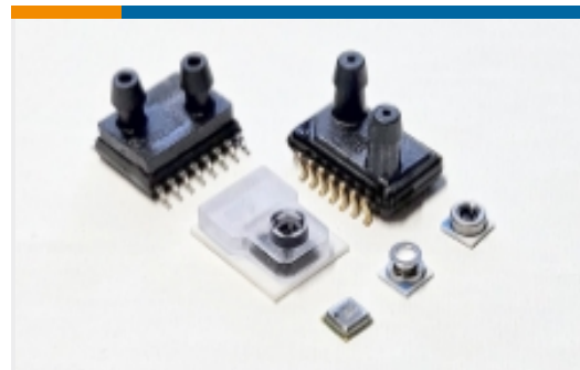
板安装压力传感器(67)