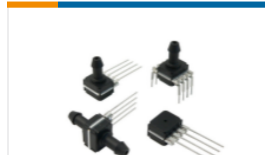
TE 产品编号2003573-F HMAB010UX7H5;PRES;0...10bar;4V;5V