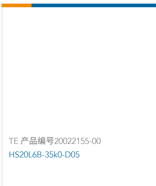
TE 产品编号20022155-00 HS20L6B-35k0-D05