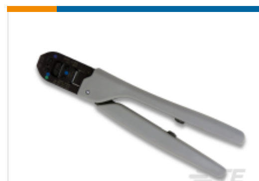
TE 产品编号 91539-1 CCII TYPE II SKT 22-14 2x18 ASSY