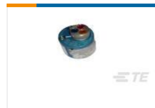
TE 产品编号 1-601967-5 POSITIONER TYPE II CONTACTS