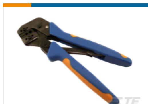
TE 产品编号 58541-1 PRO-CRIMPER HAND TOOL & DIE