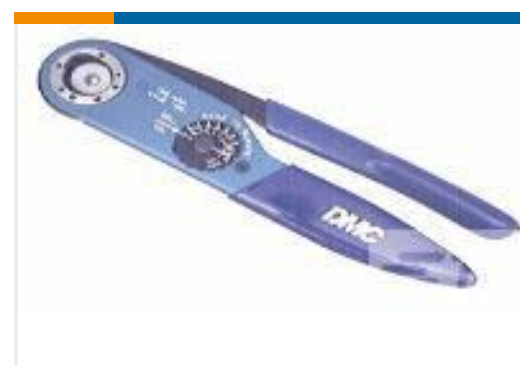
TE 产品编号 601967-1 CRIMPING TOOL M22520/1-01