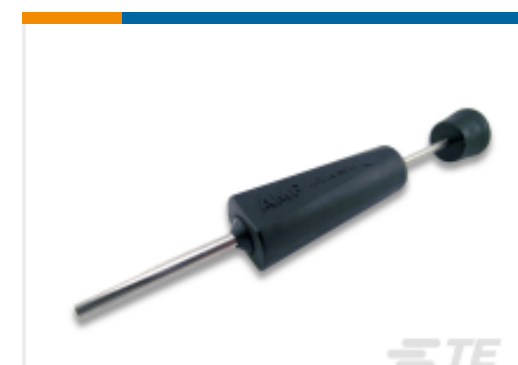
TE 产品编号 305183 EXTRACT TOOL TYPE 2 20-16