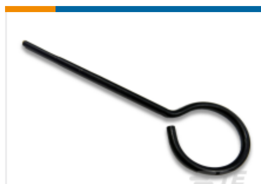
TE 产品编号 200893-2 INSERTION TOOL CONT