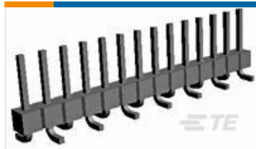
TE 产品编号1-1241150-0 10P MOD II BREAK AWAY HDR,SMD, BLISTER