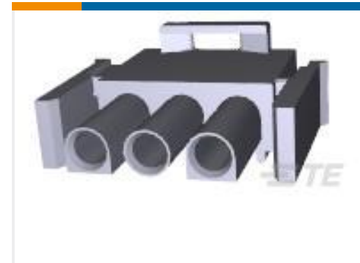
TE 产品编号1-480700-0 03P UMNL PLUG HSG NATL