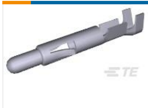
TE 产品编号350690-7 UMNL PIN 24-18 AUBR L/P