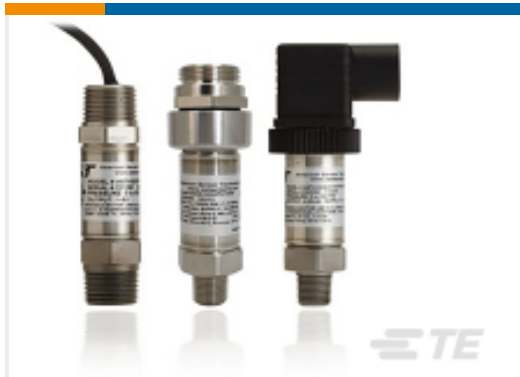
TE 产品编号20023757-00 非易燃压力变送器