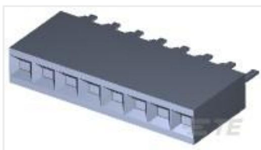
TE 产品编号5-535541-6 08 MODIV VRT SR CE 100/115