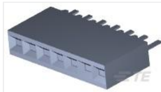
TE 产品编号534237-5 07 MODII VRT SR CE 100/115