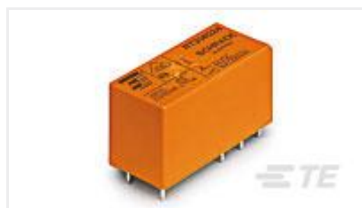
TE 产品编号6-1393243-8 RT424024