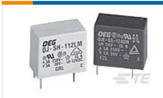
TE 产品编号1461014-2 OJ-SS-124LMHF,000