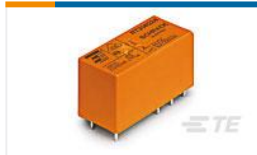
TE 产品编号6-1393243-8 RT424024