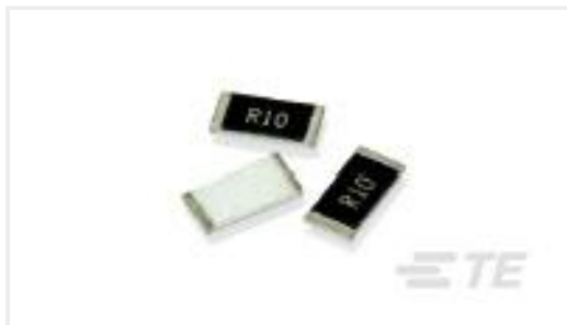
TE 产品编号2-2176057-6 RLP73K 3A R11 1% 1K RL