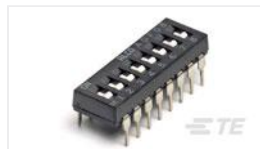
TE 产品编号1-1825059-2 ADF03STTR04=DIP S,FLUSH,SMT-GW