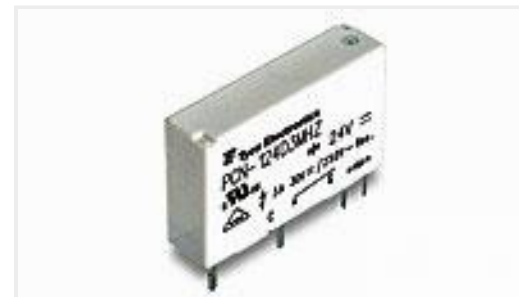
TE 产品编号3-1461491-6 PCN-124D3MHZ,000