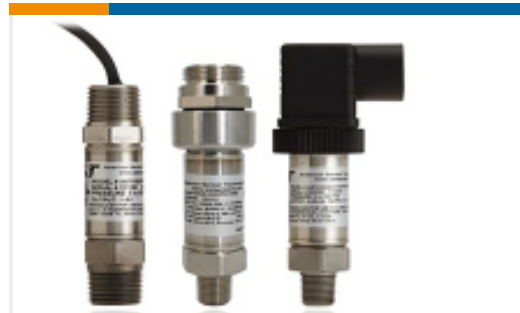
TE 产品编号11105887-00 非易燃压力变送器