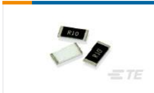
TE 产品编号2-2176057-6 RLP73K 3A R11 1% 1K RL