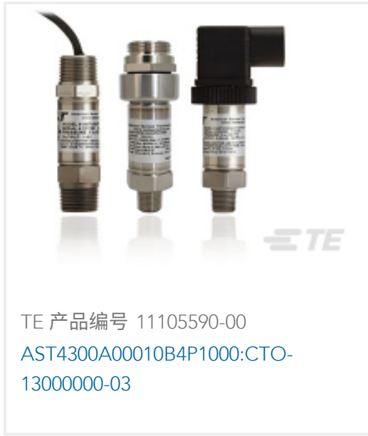
TE 产品编号 11105590-00 AST4300A00010B4P1000:CTO-13000000-03