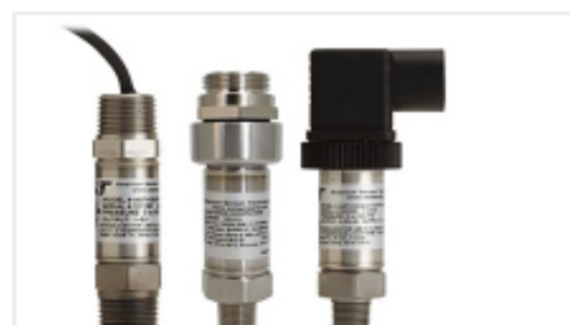
TE 产品编号11106126-00 AST4300A05000P441000-SS:CTO-13000000-03