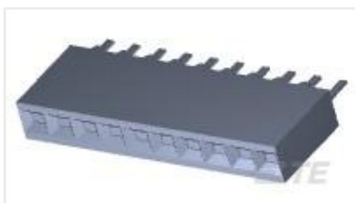
TE 产品编号5-534237-8 10 MODII VRT SR CE 100/115