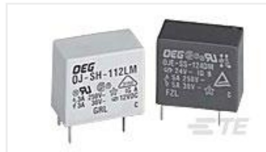
TE 产品编号1461014-2 OJ-SS-124LMHF,000