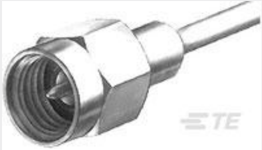
TE 产品编号227531-5 SMA PLUG W/LOOSE COUPLING NUT