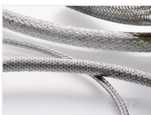
TE 产品编号EG3241-000 LWB-101-20.0 (50)