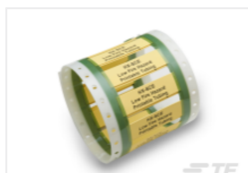
TE 产品编号CAT-T3437-H99 HX-SCE Low Fire Hazard Sleeves