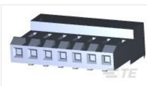
TE 产品编号3-640427-7 07P MTA156 CONN ASSY 20AWG YEL