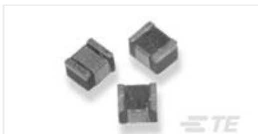
TE 产品编号2-1624112-6 3650 0402 36nH 5% 2K RL