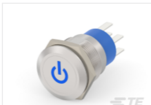
TE 产品编号7-2213766-7 AV19 DPL 3A POWER LED BLUE 12V