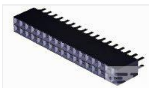
TE 产品编号1-534998-7 34 MODIV VRT DR CE 100/125