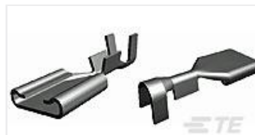
TE 产品编号61202-1 250 FASTON REC 26-22 AWG BR