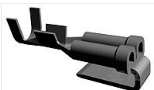
TE 产品编号62003-1 110 FASTON REC 22-16 AWG BR