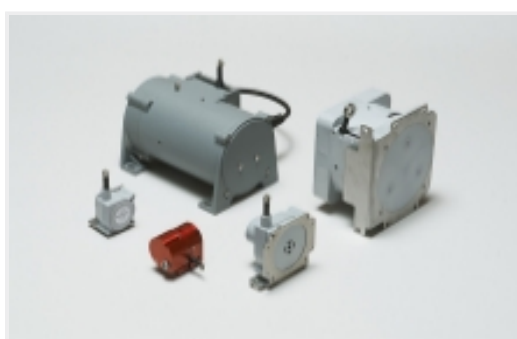
电缆致动位置传感器(32)