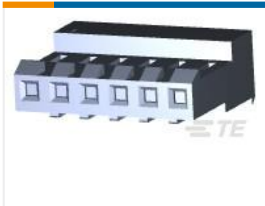
TE 产品编号3-641219-6 06P MTA156 CONN ASSY 22AWG LF