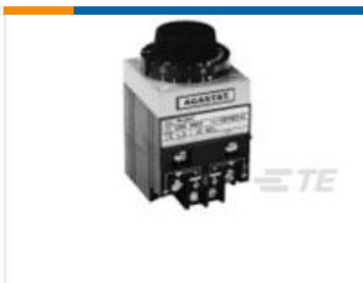
TE 产品编号1-1423164-8 7022PAM=RLY,STD,OFF,2P,125VDC