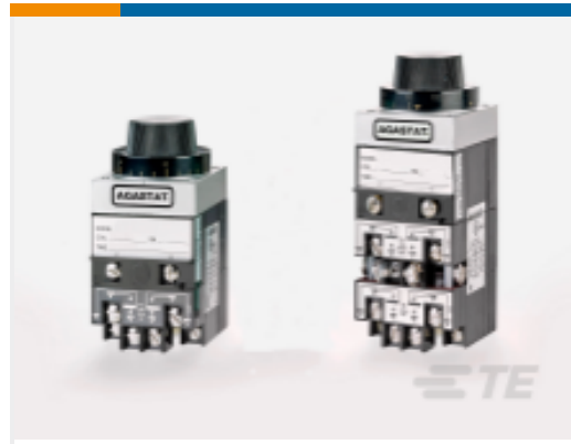
TE 产品编号5-1472973-5 7012NH=RLY,STD,ON,2P,48VDC, 30MIN