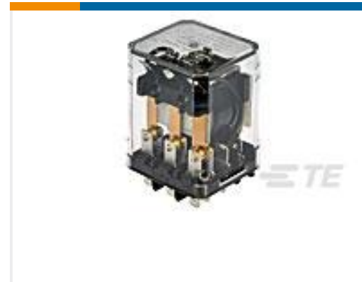
TE 产品编号4-1393118-5 KUP-17A55-120=KU