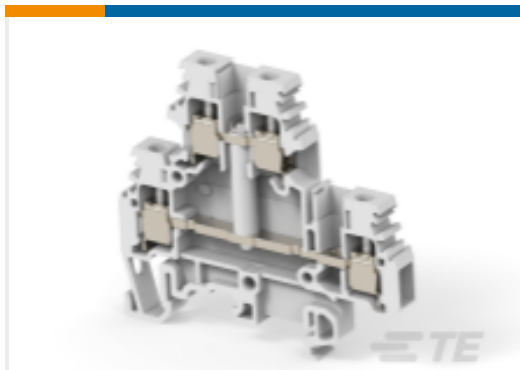
TE 产品编号1SNA115166R1100 M4/6.D1