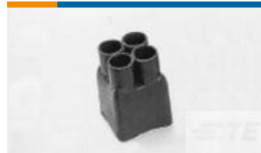
TE 产品编号034084-001 F133-200-FR