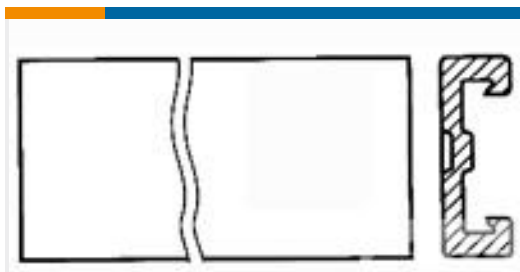
TE 产品编号640642-4 04P MTA100 COVER F/T