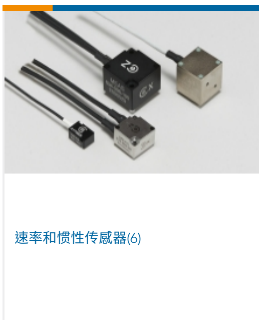
速率和惯性传感器(6)