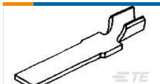
TE 产品编号62827-1 WELD TAB 24-22 AWG SST