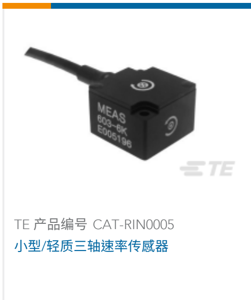
TE 产品编号 CAT-RIN0005 小型/轻质三轴速率传感器