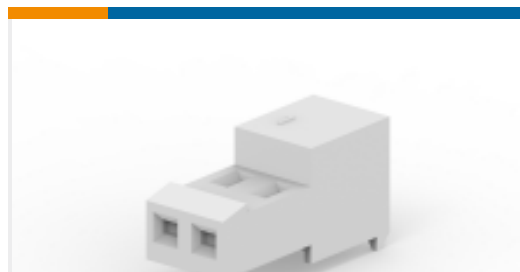
TE 产品编号3-641537-2 MTA Receptacle: Nylon, Tin Plated, 2.54 mm