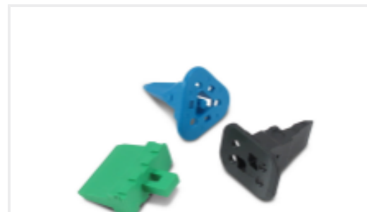
TE 产品编号CAT-D487-W416 Wedgelocks: DEUTSCH DT