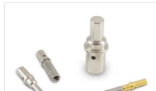
TE 产品编号CAT-D48-ST273 DEUTSCH Solid Contacts