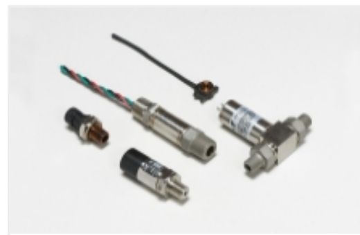
工业级压力传感器(42)