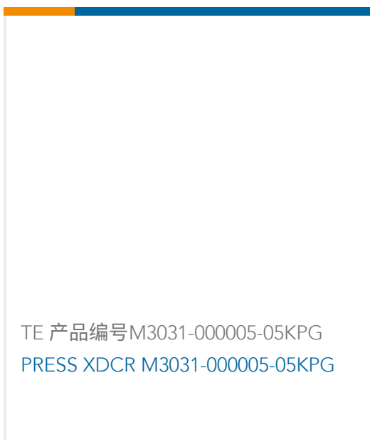
TE 产品编号M3031-000005-05KPG PRESS XDCR M3031-000005-05KPG