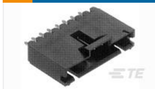
TE 产品编号103639-5 06 MTE HDR SRST LATCH .100CL