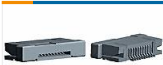
TE 产品编号1734592-6 FPC CONN. 0.5MM PITCH B/C, 6P