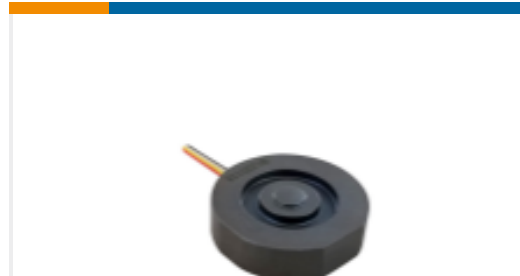
TE 产品编号20009605-22 FX29K0-100A-0050-L