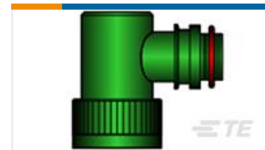
TE 产品编号311611-000 TXR40AB90-1410AI