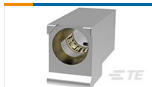
TE 产品编号2000713-6 RA Keyed Guide Mod, Vita 46, Machined