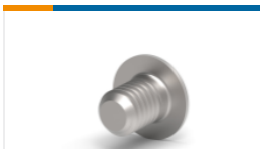
TE 产品编号1410946-3 MULTI-GIG SOC. CAP SCREW, CUSTOMIZED HDW