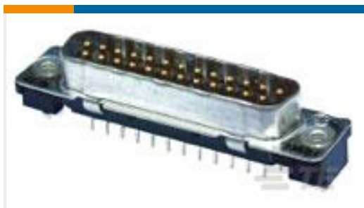
TE 产品编号2-5747704-0 25 PLUG SP/FMS BRDLK