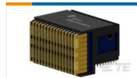
TE 产品编号2102847-1 DC, 7Row, Center, MULTIGIG RT 2R