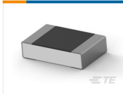
TE 产品编号4-2176374-5 RQ 0805 309R 0.1% 10PPM 1K RL