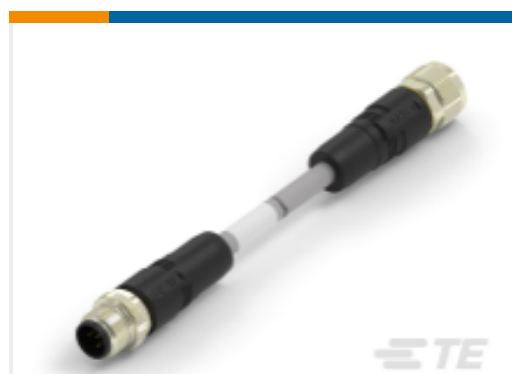
TE 产品编号TAA755A1611-080 M12A5-MS-FS-PVC-8.0M