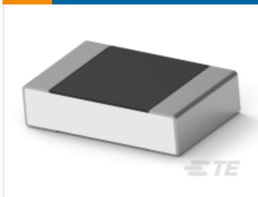
TE 产品编号6-2176375-4 RQ 0805 5K23 0.1% 10PPM 1K RL