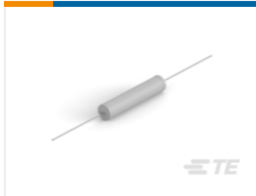
TE 产品编号2-2176415-9 8W STD M/OX 5% 430R