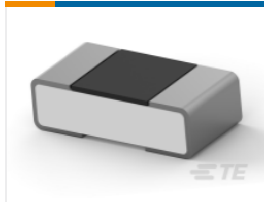
TE 产品编号2-2176364-3 RQ 0402 7K87 0.1% 10PPM 5K RL