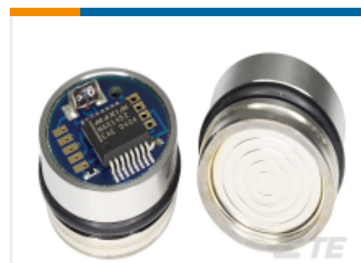
TE 产品编号86A3R-000000-100PG 100 PSIG ANALOG PRESSURE SENSOR