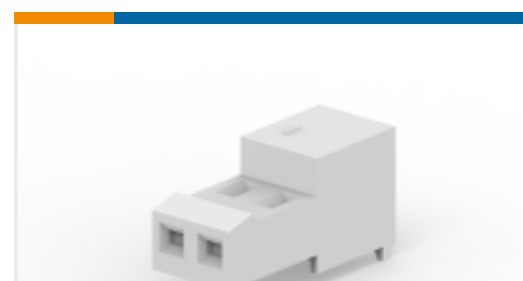
TE 产品编号3-641537-2 MTA Receptacle: Nylon, Tin Plated, 2.54 mm