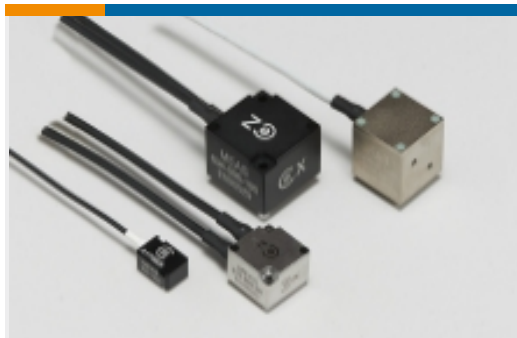
速率和惯性传感器(16)