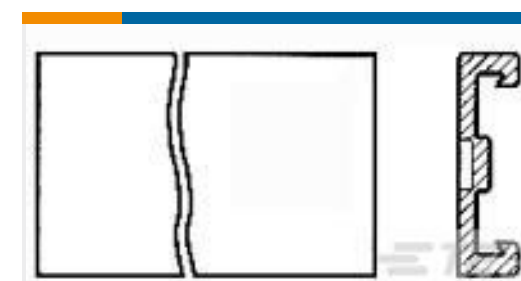
TE 产品编号640643-3 03P MTA156 COVER F/T