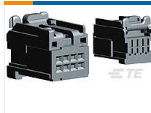
TE 产品编号1452015-2 2X6UNS.FEM ASSY"B"