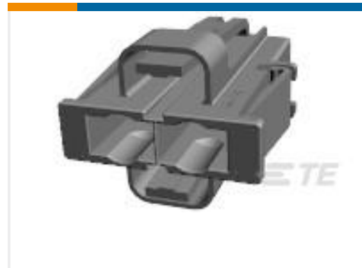
TE 产品编号1355289-2 MCP9,5BU-GEH2P, GRAU