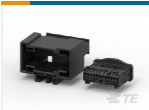
TE 产品编号1-968322-1 MQS 连接器外壳