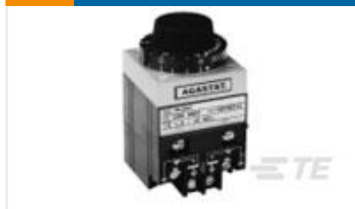
TE 产品编号1423157-6 7012ACL=RLY,STD,ON,2P,120VAC,1