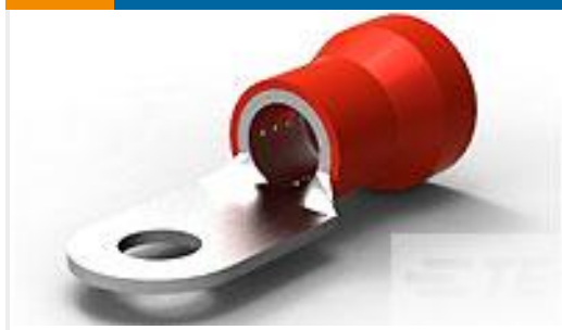
TE 产品编号52044-4 TERMINAL R PG 2 5/16