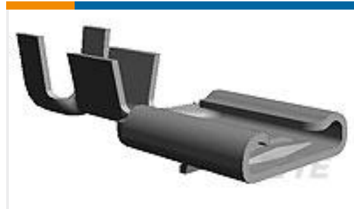
TE 产品编号6-160449-5 FF 250 REC 1.0-2.5MM2 TPBR LP