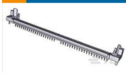
TE 产品编号5822138-4 80 ME .050 L/P AU M/L PB-FREE