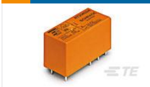
TE 产品编号2-1393243-4 RTE25524