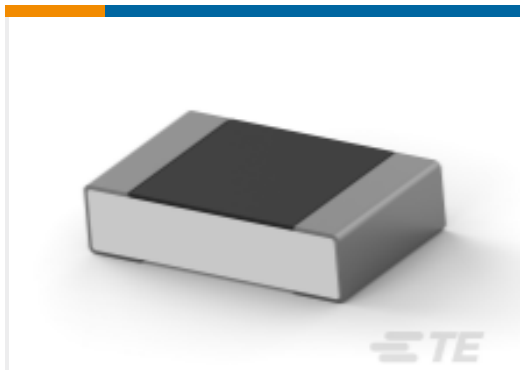
TE 产品编号9-2176374-8 RQ 0805 1K1 0.1% 10PPM 1K RL