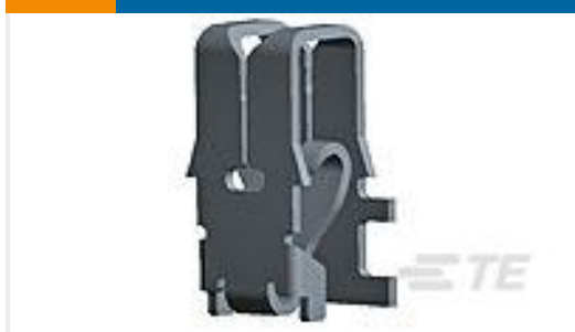
TE 产品编号964339-1 MAG MATE KONT. MKII