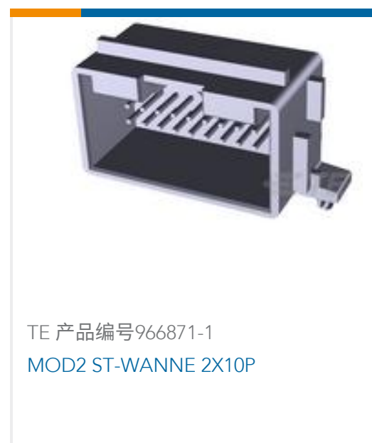
TE 产品编号966871-1 MOD2 ST-WANNE 2X10P