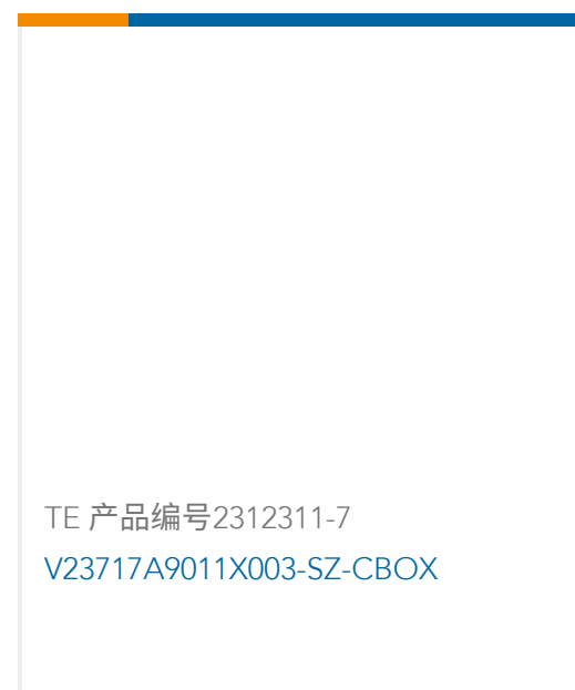
TE 产品编号2312311-7 V23717A9011X003-SZ-CBOX