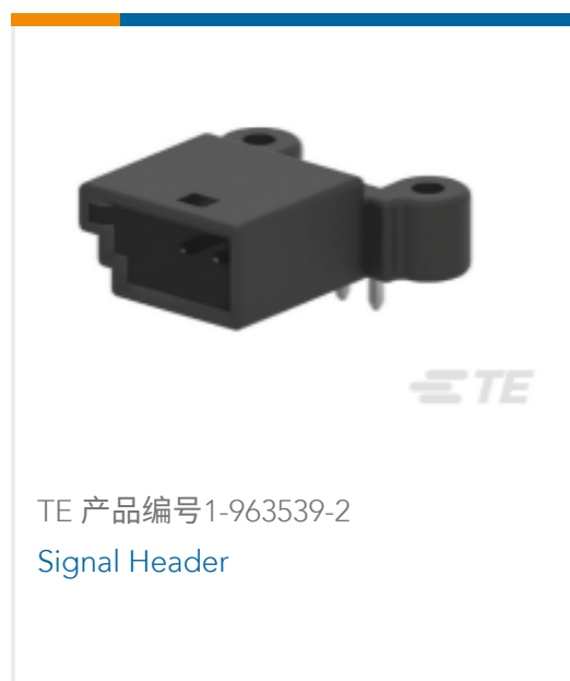
TE 产品编号1-963539-2 Signal Header