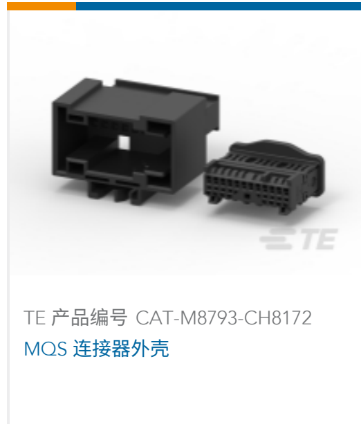
TE 产品编号 CAT-M8793-CH8172 MOS 连接器外壳